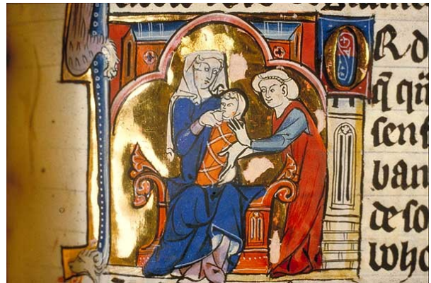
Reine et mère (Elaine allaitant Lancelot)