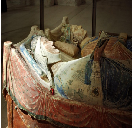
Gisant d'Aliénor d'Aquitaine, au second plan Henri II Plantagenêt, à l'Abbaye de Fontevraud.

Au printemps 1200, Aliénor se retire à Fontevraud. Son règne semble terminé. C'est désormais Jean sans Terre qui gouverne le royaume. Mais ce dernier perd peu à peu la Normandie. En août 1204, Philippe Auguste avait pris possession de toute la Normandie et de Poitiers mais pas du reste de l'Aquitaine que Jean conserva !